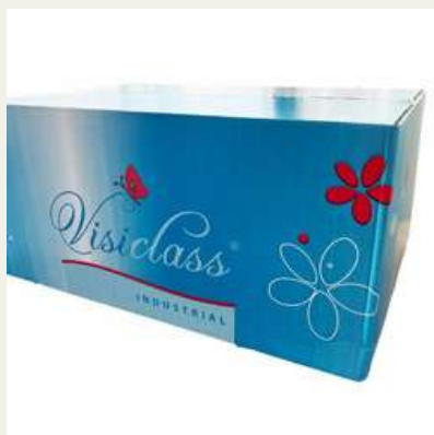
Toalhas tissue 23x25 (3200 f)