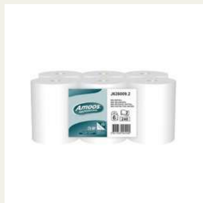
Rolo mini mecha