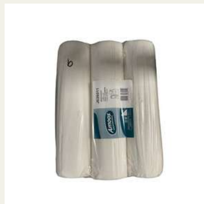
Rolo marquesa 50x60 c/3 rolos