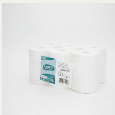
Rolo autocorte 2fls 100mt c/6