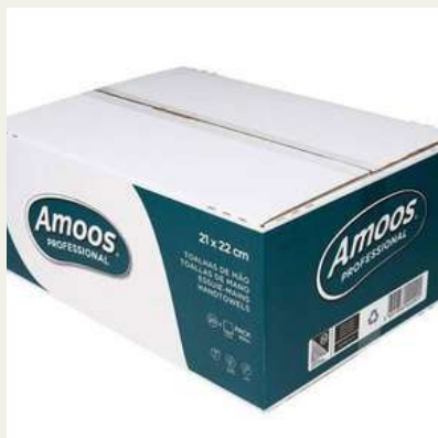
Toalhas para mãos Tissue c/3000f