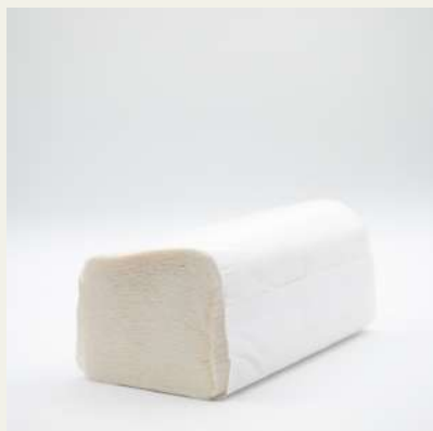
Toalhas para mãos 21x23