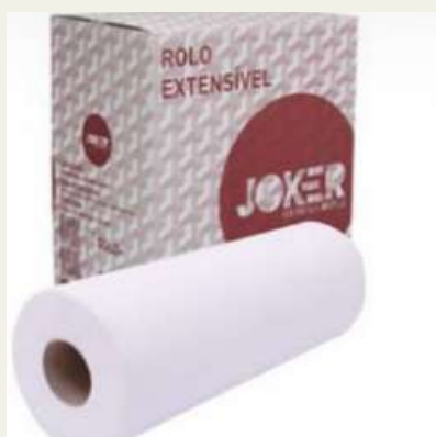
Rolo marquesa 50x60mt s c/6 rolos