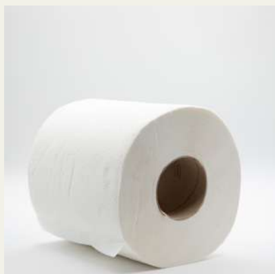
Rolos seca mãos 1ª c/6