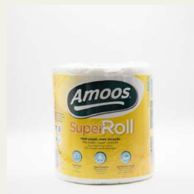
Rolo de cozinha 2F multiusos