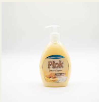
Sabonete liq. 600ml Plok