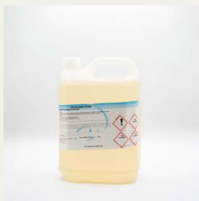
Gel espuma 5L