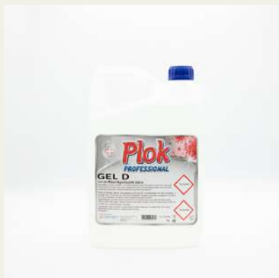
Sabonete liq. desinfectante/ bactericida 5L