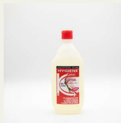
Álcool gel 800ml