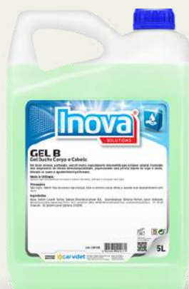
Body Gel 5L