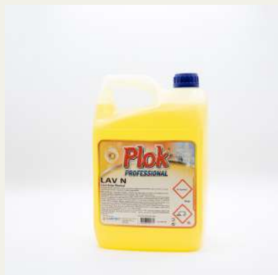
Lava loiça manual 5L