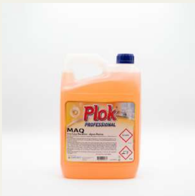
Lava loiça Maq. 5L