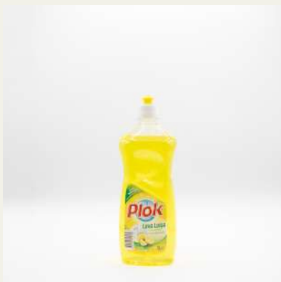
Lava loiça 1L