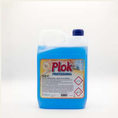
Secante abrillantador 5L