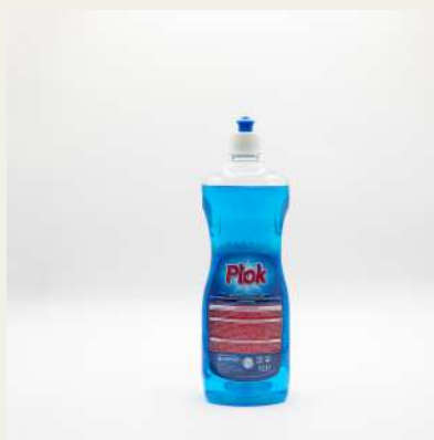
Abril提高ador de maq. 1L