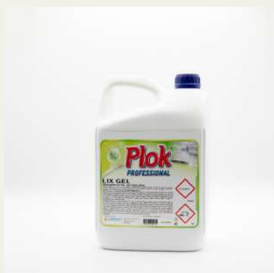
Lixívia c/detergente em gel 5L