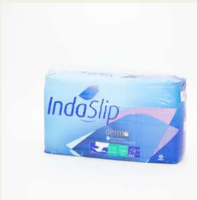
Fralda Indaslip c/ 28 M