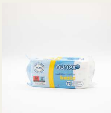
Toalhete húmidos Nunex