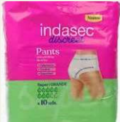
Fralda Cueca L