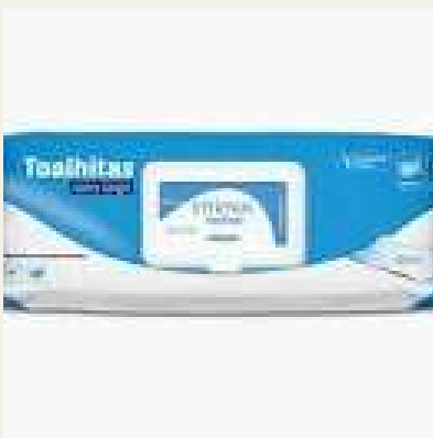
Toalhete húmidos íntimos