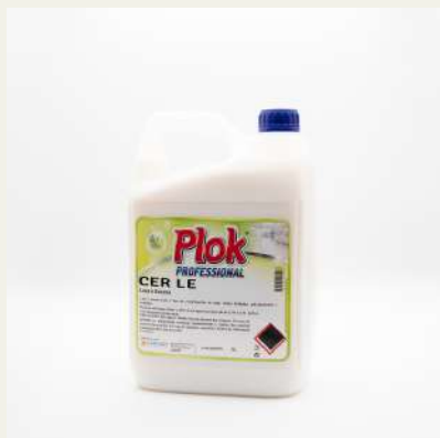
Lava encera 5L