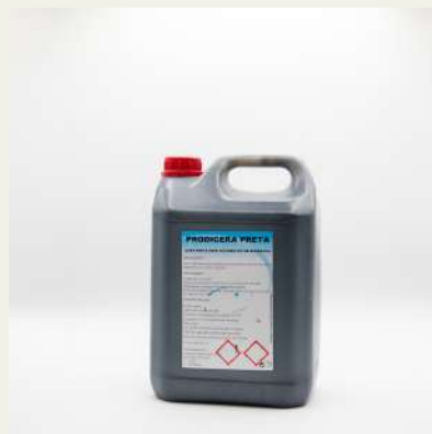
Cera preta 5L