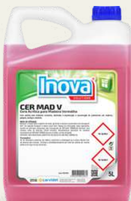
Cera vermelha 5L