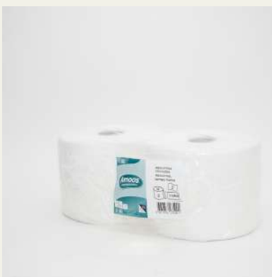
Rolo industrial grof 2f c/2