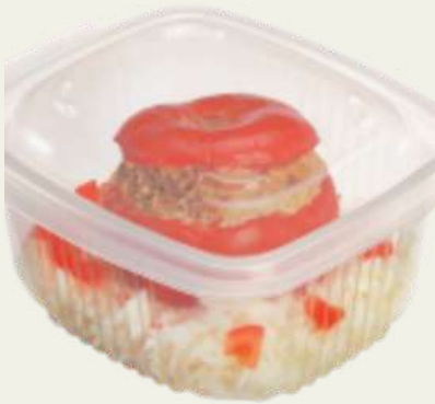
Forma com tampa acoplada