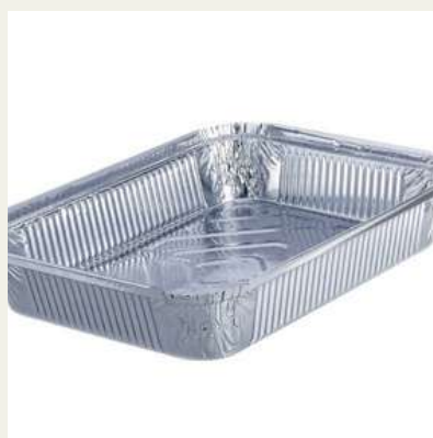
Forma retangular alumínio