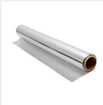
Rolo de papel alumínio