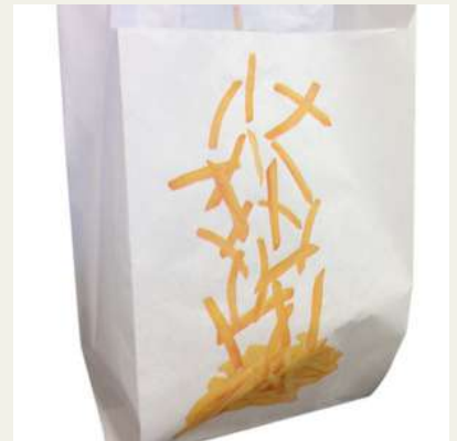
Saco p/batata frita c/int.vegetal G 10Kg