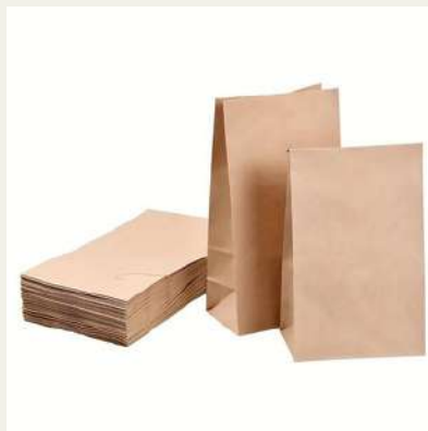
Saco papel kraft S10 42x18x8c/1000