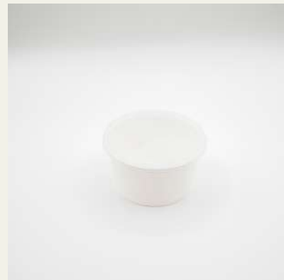
Forma sopa pequena