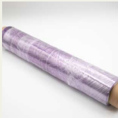
Filme contínuo 45x45