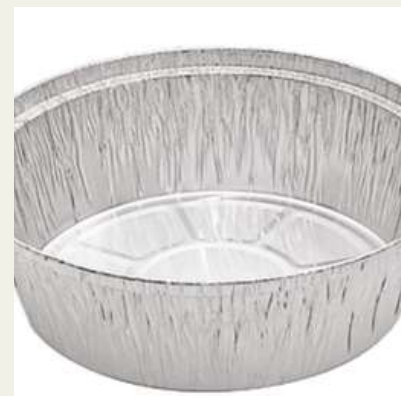
Forma redonda alumínio