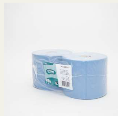
Rolo industrial azul c/2