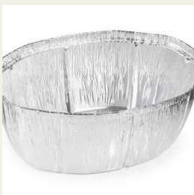
Forma oval alumínio