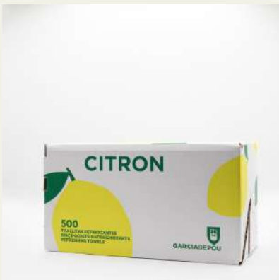
Toalhitas refrescantes limão c/500