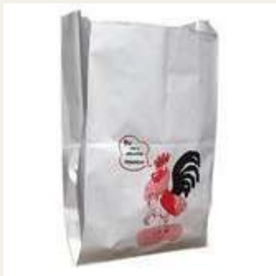
Sacos para frango XL cx c/500