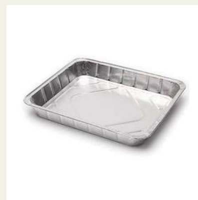
Forma grande alumínio