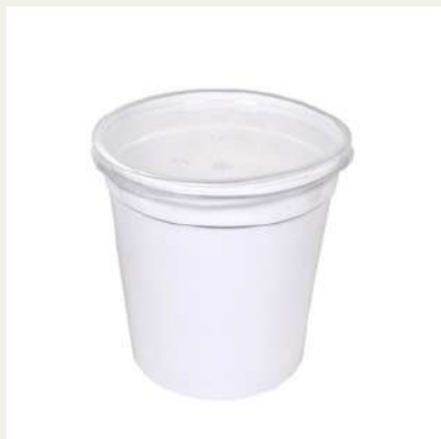
Forma sopa grande